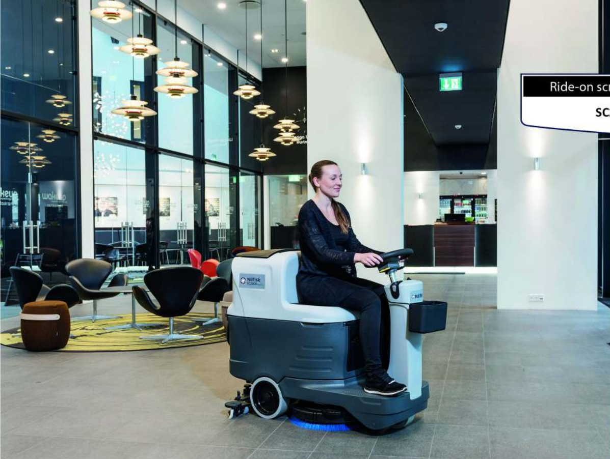
Ride-on scrubber/dryer SC2000